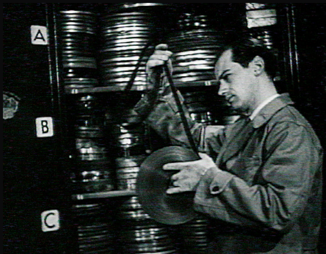
Il museo dei sogni, Luigi Comencini, 1949

Il 22 marzo 1947 Fondazione Cineteca Italiana veniva fondata a Milano.