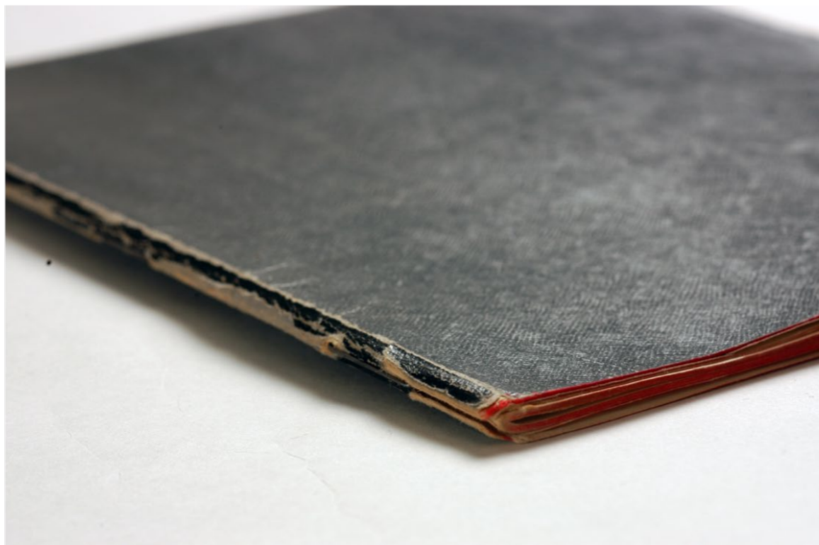
Bergman's first notebook, 1938