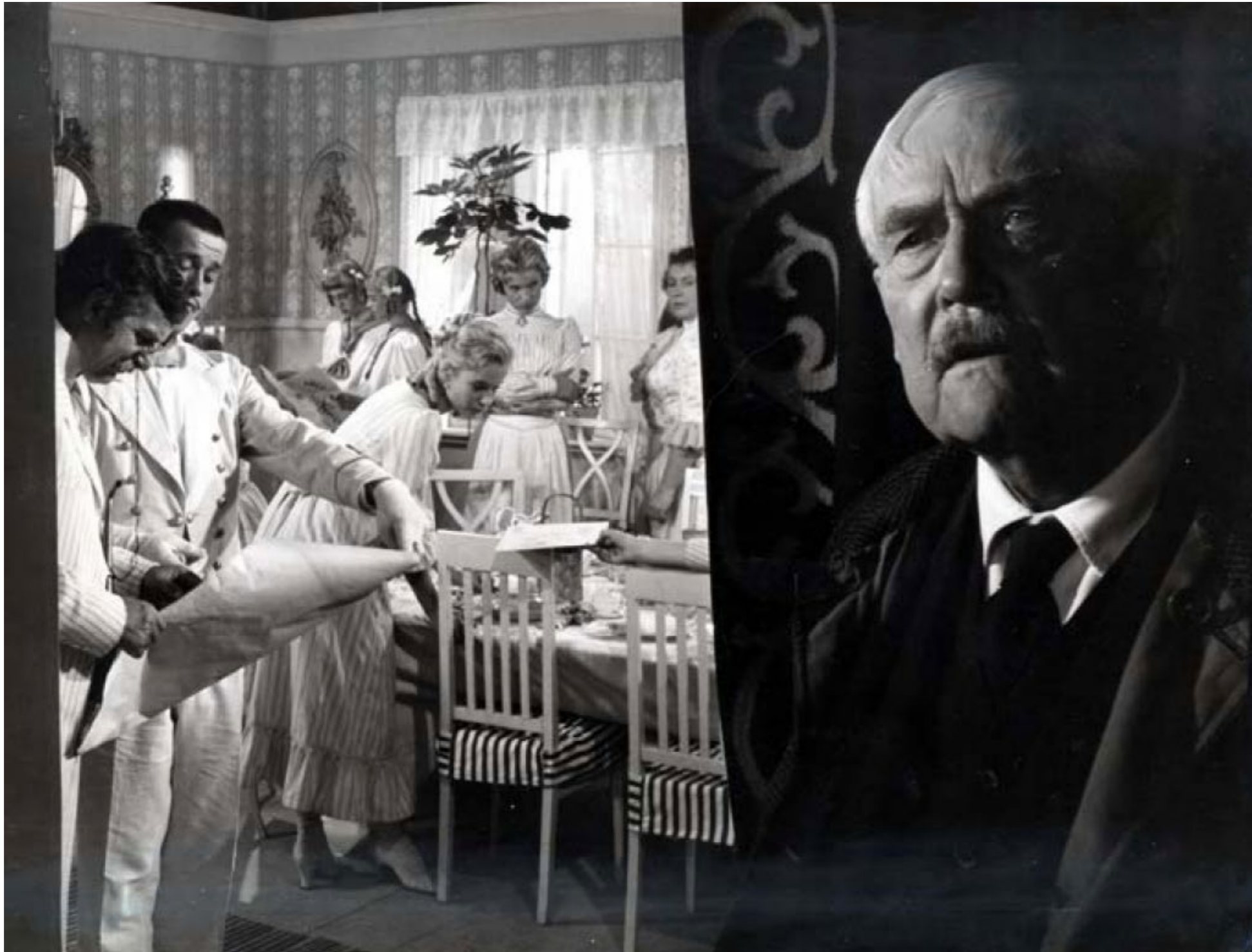
Victor Sjöström as Isak Borg in Wild Strawberries , Ingmar Bergman 1957