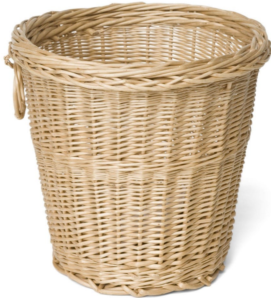
Dustbin, IKEA, c. 1980s. Provenance: Ingmar Bergman. Sold at auction in 2007 for €1,250.