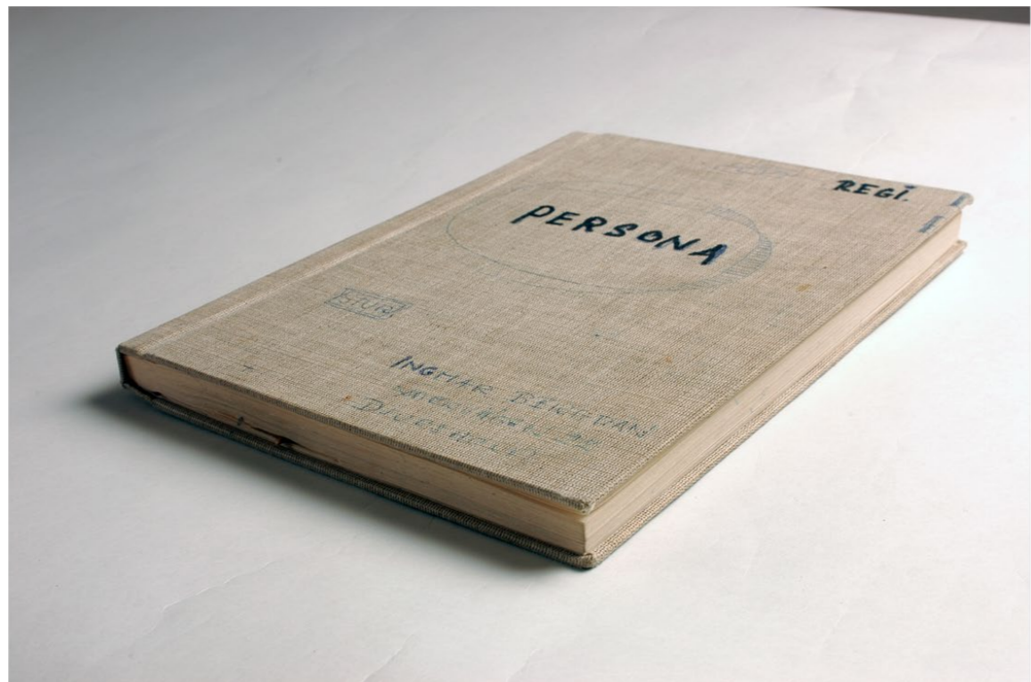
Shooting script to Persona , 1965