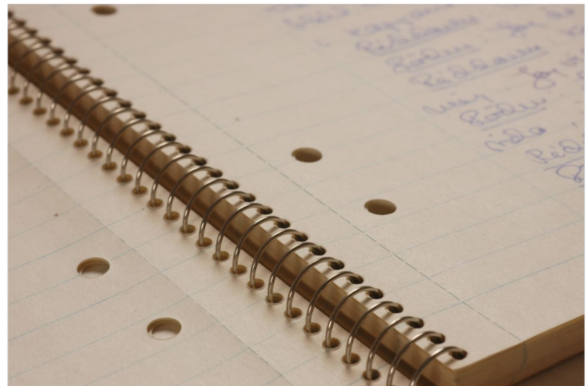
Notebook to The Seventh Seal , 1956