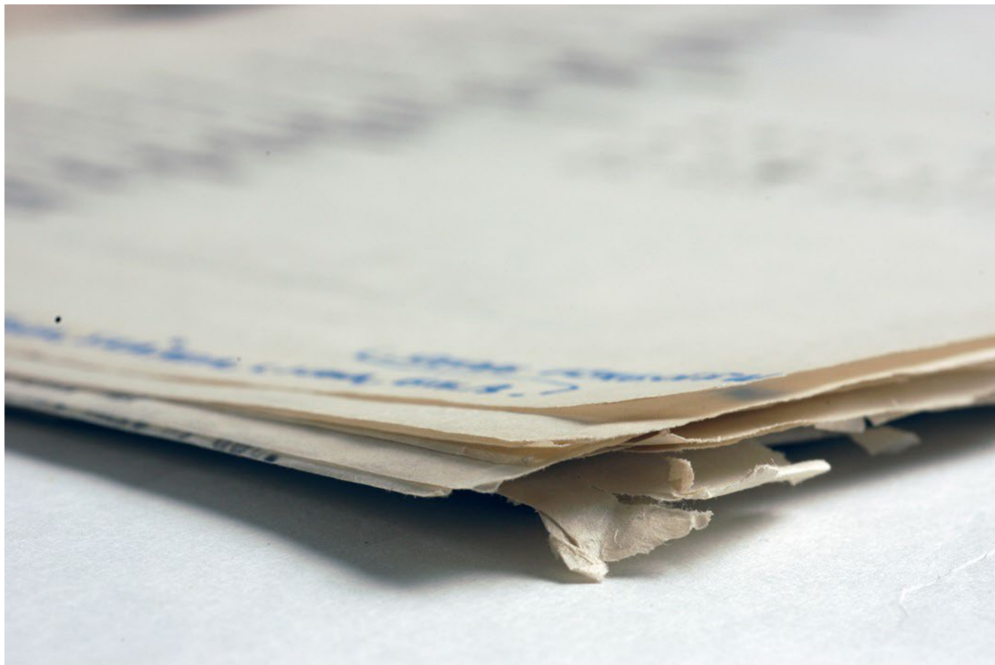
Manuscript to Prison (Ingmar Bergman, 1948)